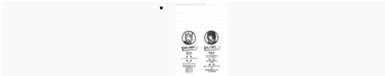
Yuigahama Yui , Yukinoshita Yukino

Lo único dulce en mi vida es el sabor de este Sportop.